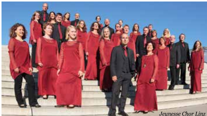
Jeunesse Chor Linz