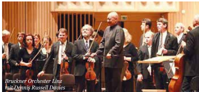
Bruckner Orchester Linz mit Dennis Russell Davies