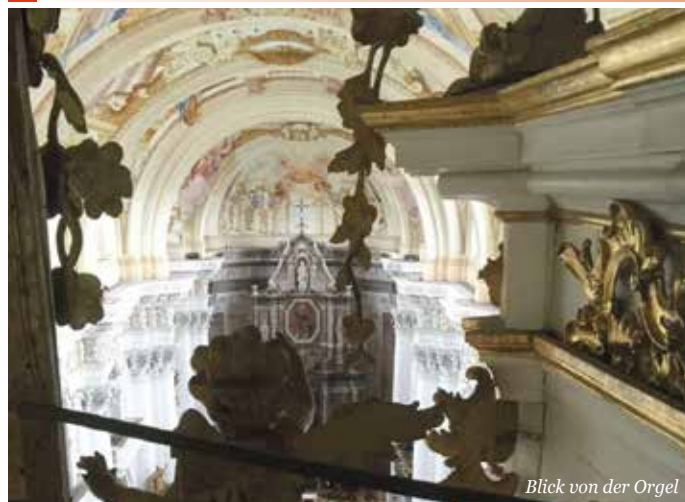
Blick von der Orgel