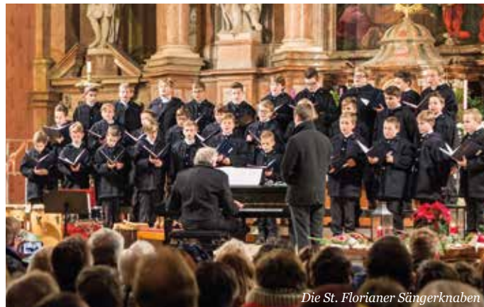
Die St. Florianer Sängerknaben