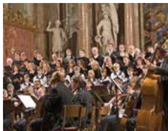
StiftsChor St. Florian