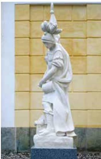
Landespatron St. Florian