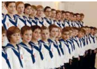
St. Florianer Sängerknaben