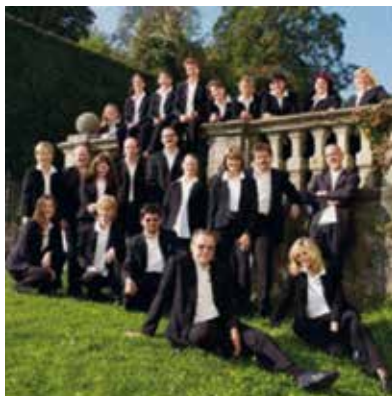
Florianer Chor Anklang