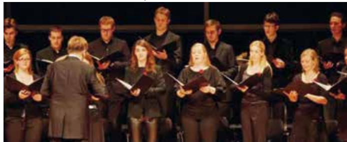
Chor der Universität Mozarteum Salzburg